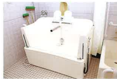
浴槽の出入りがご不安な方用の浴槽です