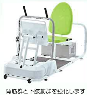
背筋群と下肢筋群を強化します