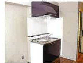
201号室、202号室に ミニキッチンと浴室完備