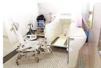
イスのままご入浴いただけます