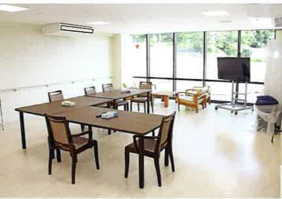
食堂・デイルーム