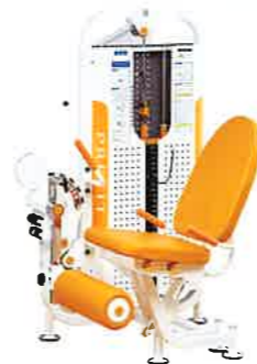
大腿の筋力を強化します