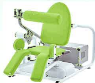
正しい姿勢や動作の安定性を高めます